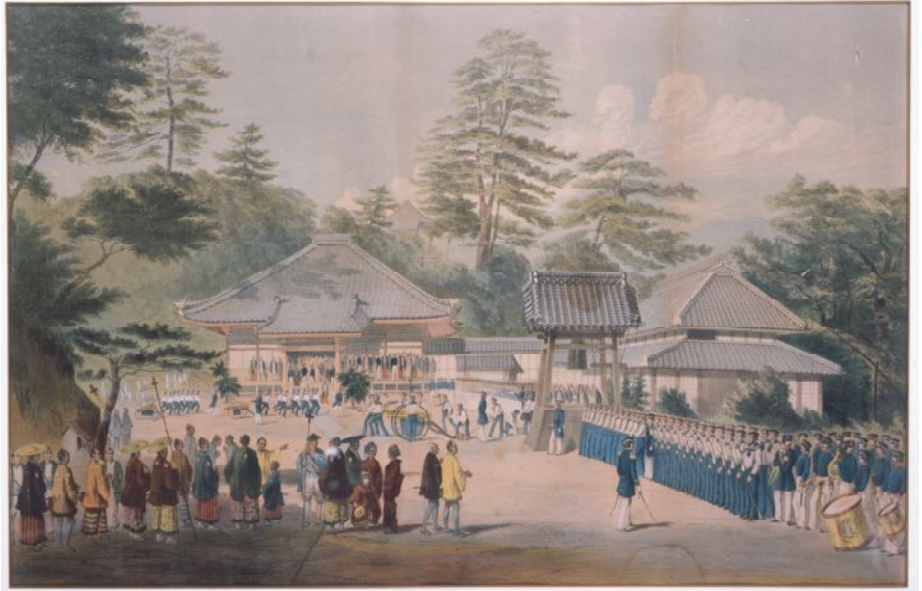
ペリー陸戦隊了仙寺調練の図（1856年）